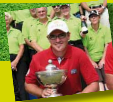
Adrien Mörk : the first official 59 in the history of the European Tour.